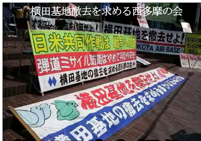
横田基地撤去を求める西多摩の会

米軍横田基地で給油するジェット機、輸送機に使用する燃料は、川崎市安善にある米軍油槽基地から、南武線、青梅線を通じて拝島駅まで運ばれています。 現在、一日一列車12両編成で運行しています。最近までは週2日程度の運行でした。ところが9月に入り運行回数が激増しているようです。関係者によると、月21日運行に増えているというのです。 それだけ需要が増えていることを示しており、飛行回数や量に影響することは明らかです。 理由は分かりませんが、