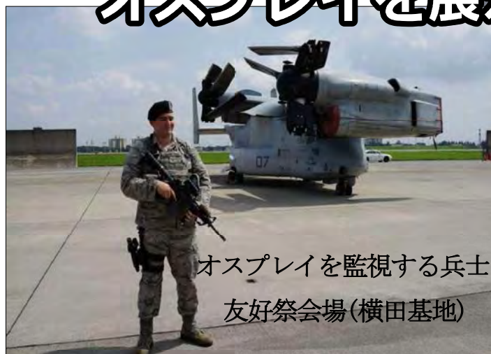
オスプレイを監視する兵士 友好祭会場(横田基地)

9月6日、7日に行われた横田日米友好祭には周辺住民の反対を押し切ってM V22オスプレイ2機が飛来し展示された。祭りの目玉として、ひと目見ようと群がる人たち。災害時に救援するために作られていない危険な代物が、わが家の上空を爆音を残して飛んでいった。