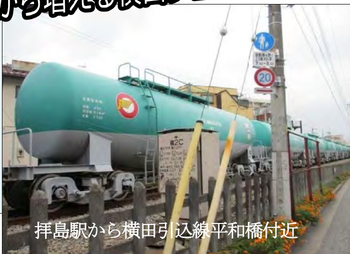
拝島駅から横田引込線平和橋付近

た。入りなすばよならな時のラせん分 かで り情。かりうら事のクンがかり理由 ま報そり願らないのクがイまは しがんでういにう争イまは 福生公園で友好祭来場者に宣伝する