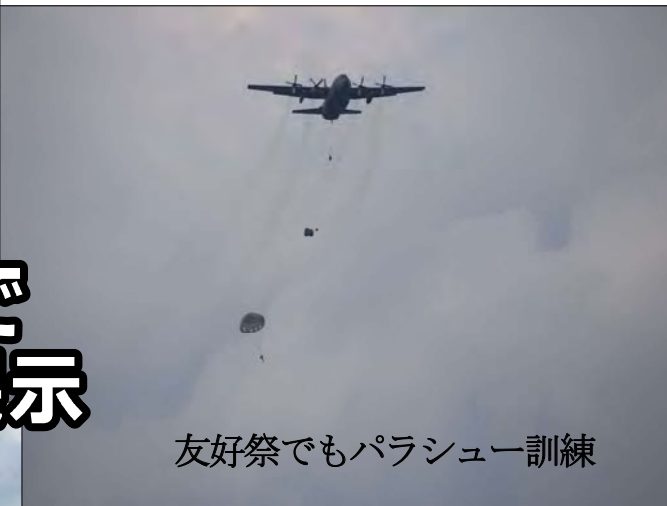
友好祭でもパラシュート訓練